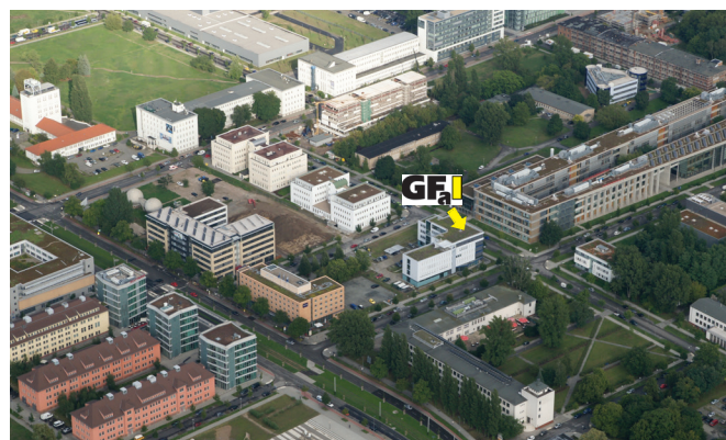
The building of the GFaI in the science and technology park Berlin-Adlershof